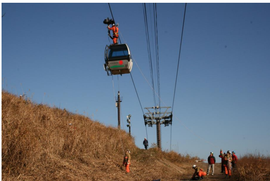
＜ゴンドラ救助訓練風景＞