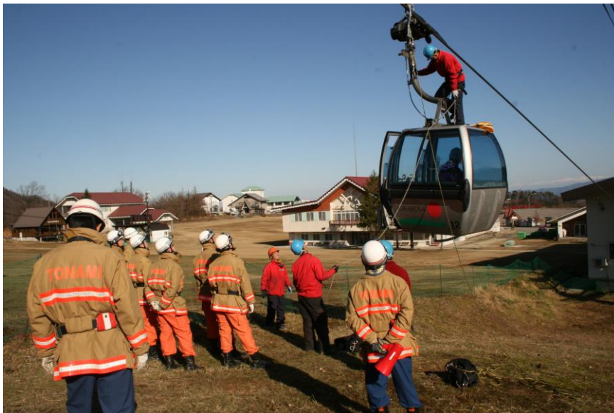
<ゴンドラ救助訓練風景>